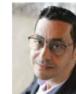
FOUAD SIDALI wethouder Culemborg