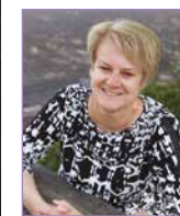
's Heeren Loo

IK VIND HET FIJN DAT MIJN FAMILIE EN VRIENDEN TROTS OP MIJ ZIJN