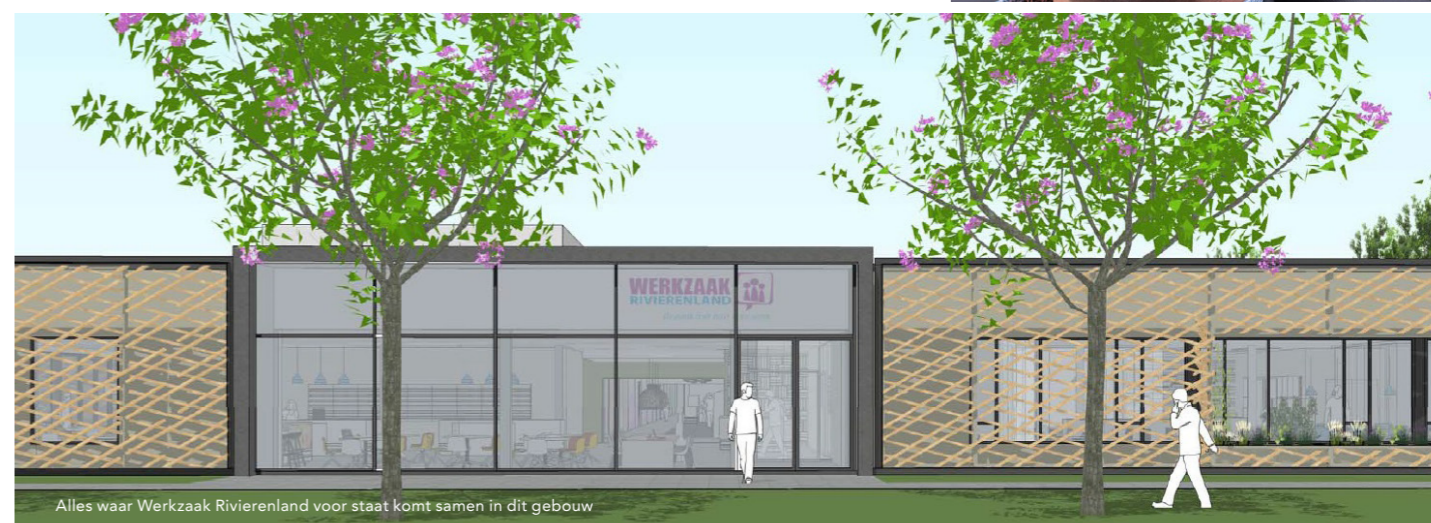
Alles waar Werkzaam Rivierenland voor staat komt samen in dit gebouw