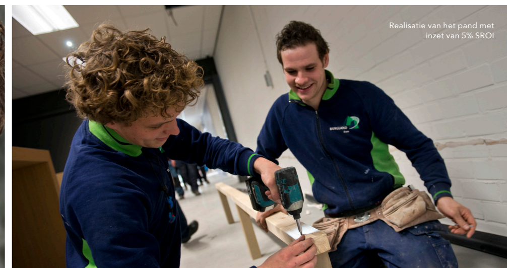
Realisatie van het pand met inzet van 5% SROI